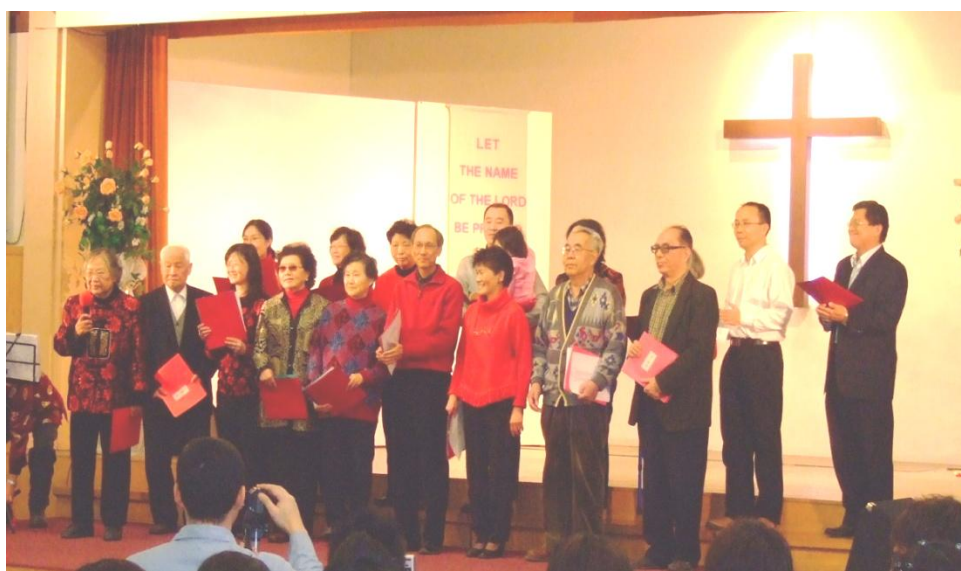
迦勒团契 2010 年在华基春节联欢会上演唱《天国八幅》

今年参加我们团契活动的除一些本教会的老会友外，还有几名来自其他教会的基督徒朋友和一些来探亲的老年朋友，我们的团契成了老年朋友的家。愿神继续看顾保守我们这个温馨的基督之家。阿门！